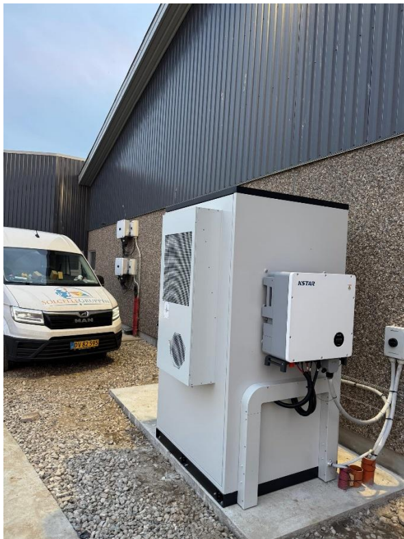
Eksempel på batteri